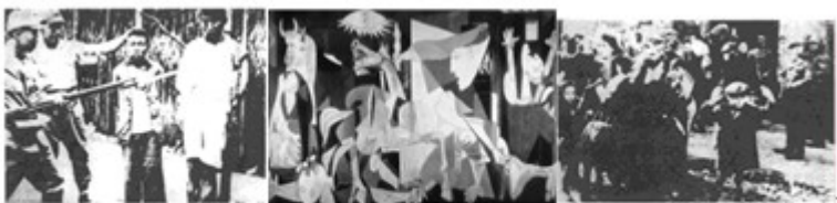
日军刺杀中国人……《格尔尼卡》→ 纳粹迫害犹太人