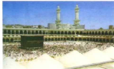
②麦加大清真寺——伊斯兰教