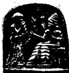
《汉谟拉比法典》石柱局部图