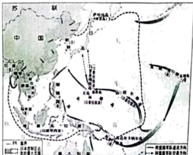
第二次世界大战期间的亚洲和太平洋战场示意图