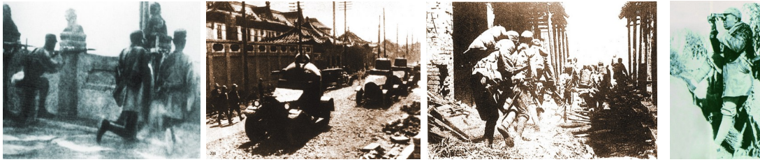
① 中国军队在卢沟桥上自卫反击