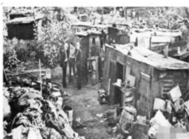
经济大危机时期美国穷人居住的棚户区——“胡佛村”