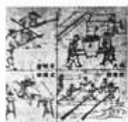
图1 中国古代四大发明