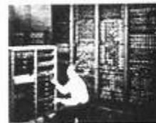
图4 世界第一台计算机