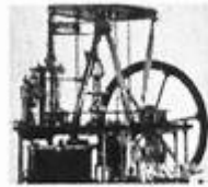
图 2 改良蒸汽机