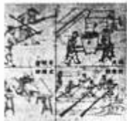
图 1 中国古代四大发明