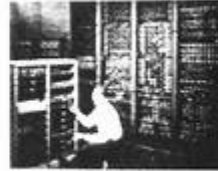
图 4 世界第一台计算机