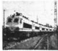
图 3 电力机车