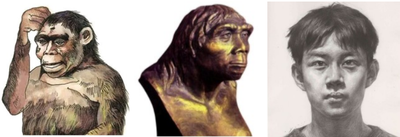
“古猿头像” “北京人头部复原像” “现代人头像”