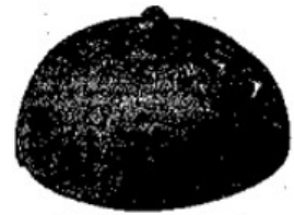
图 衡器八斤铜权 陕西西安、咸阳、临潼等地均有出土

(2) 史料是我们了解历史的重要依据，主要包括：文献史料、实物史料、口述史料等多种类型。上图所示均属于哪一类型的史料？它们见证了秦始皇巩固大一统的哪两项措施？