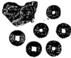
图 (秦) 半两铜钱 内蒙古赤峰、陕西临潼等地均有出土