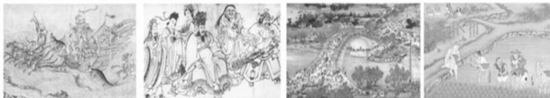
《洛神赋图》(局部) A 《天王送子图》(局部) B 《清明上河图》(局部) C 《耕织图》(局部) D