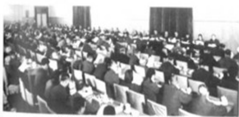
中共十一届三中全会会场

我国的经济体制改革在经历了 80 年代初以农村改革为重点的第一阶段,和 80 年代中后期以城市为重点、城乡联动和全面改革以来,以中国共产党十四大为标志,改革进入了新阶段。