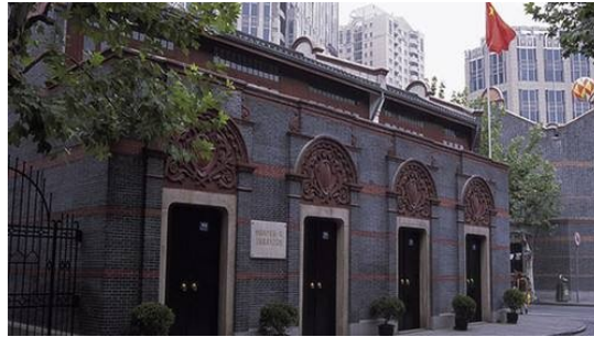
五四时期的爱国纪念章 中国共产党第一次全国代表大会上海会址

(1) 作为历史资料的这枚“纪念章”至今已保存了多少年？中国共产党第一次全国代表大会的召开有什么历史意义？（3分）