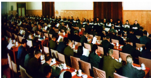
中共十一届三中全会会场

(3) 中共十一届三中全会作出的历史性决策是 (4分) (4) 综合上述材料，你认为怎样才能实现中华