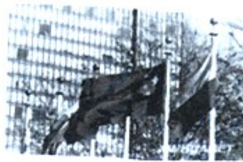
图2 五星红旗在联合国 大厦前飘扬