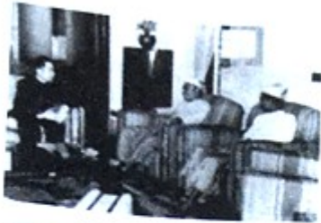
图1 1954年6月周恩来与 缅甸总理吴努会谈