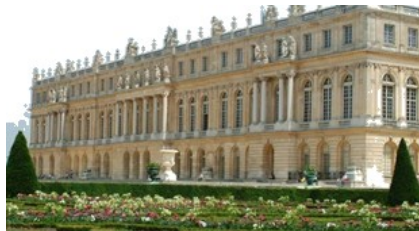
图一 帕特农神庙遗址 图二 圆明园遗址 图三 凡尔赛宫