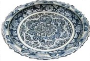
元代·青花蓝地白花云肩凤纹花口大盘 (伊朗出土)

材料一 青花瓷，国白地青花纹饰而得名。其青（蓝）色源于一种西亚的矿物染料。元代崇白尚蓝，与伊斯兰尚色之风相合。瓷面装饰布局繁密，融合阿拉伯纹饰对称连续的风格。