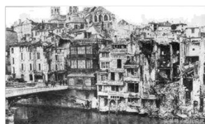
图二 遭到炮轰后的凡尔登