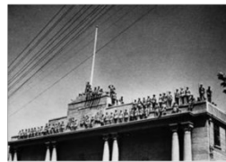
图一《南京条约》 签订的场景