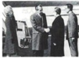
图一 中国代表团在 26 届联合国大会上 图二 尼克松总统与周恩来总理历史性握手