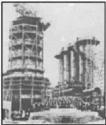
八幡制铁所（钢铁厂）