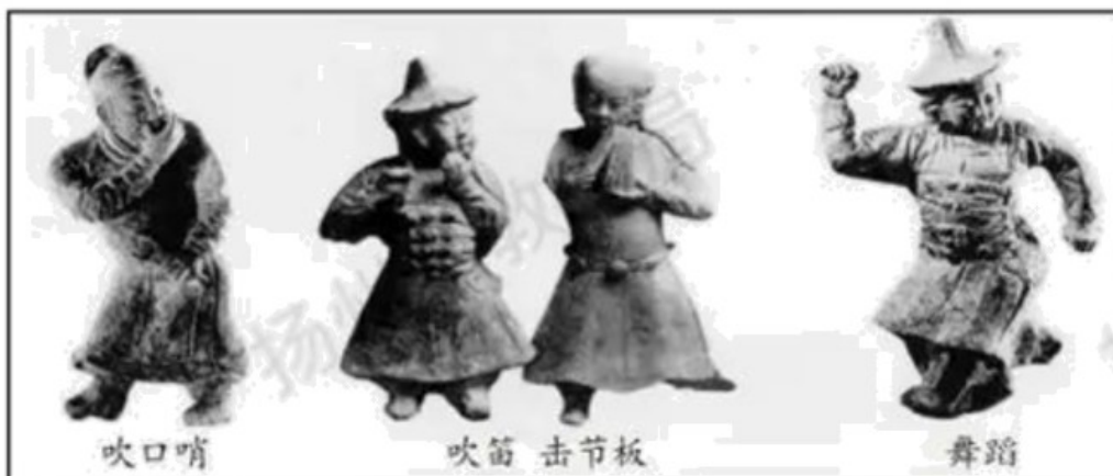
元墓出土的杂剧陶俑

材料二 宋杂剧为元朝戏剧的发展打下了基础。由于元统治者不重用汉人知识分子，一些不得意的文人、落魄之士，用他们的智慧创造了中国文学史上又一辉煌的篇章——元曲。戏剧的产生必须在社会经济充分发展的城市中，有充足的市民人数和文娱活动的需要，才有可能形成集中的观众群体和以演剧为生的艺人群体。