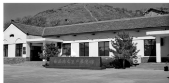
南泥湾大生产运动展览馆（延安）