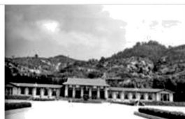
延安革命纪念馆（陕北）