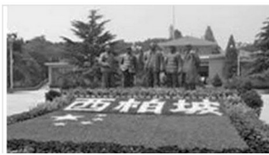
西柏坡纪念馆（河北）

(1) 如果有机会去参观上述六个纪念馆中的两个，你会选择哪两个？写出你所选的两个纪念馆，分别写出一条选择的理由。（要求：选答两个，多选多答则只评前两个）