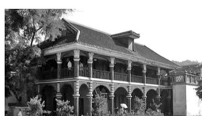
遵义会议纪念馆（贵州）