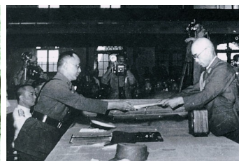
图 9 中国战区代表接受冈村宁次签字的投降书

(3) 2015 年是中国人民抗日战争暨世界反法西斯战争胜利 70 周年。为使全国人民广泛参与中央及各地区各部门举行的纪念活动，9 月 3 日全国放假 1 天。读图 7——图 9，综合概括抗日战争的相关信息。(4分)