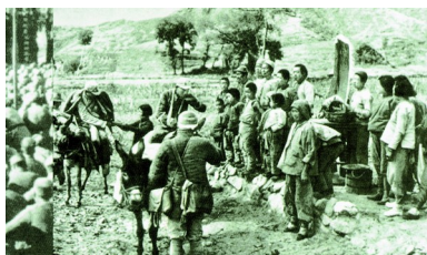
图 8 百团大战中的一个八路军伤病员慰问站