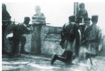
图 7 中国军队在卢沟桥上自卫反击