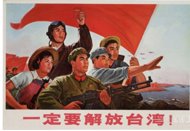
图3 新中国早期宣传画

(2) 图3表达了新中国的什么目的？(1分) 后来，为解决台湾问题提出了什么构想？(1分) 这一构想有哪些成功的实践？(2分)