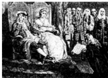
图6 威廉和玛丽接受《权利法案》