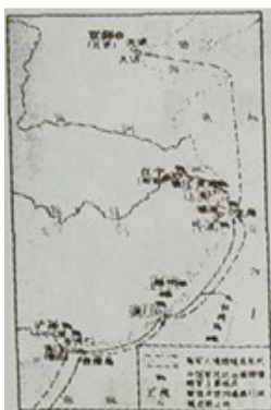
鸦片战争形势示意图