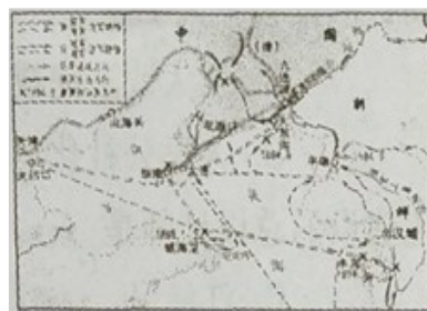
甲午中日战争示意图