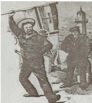
德国(左)向英国(右)提出挑战(漫画)