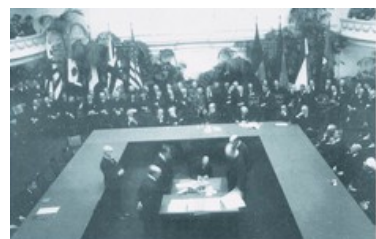
图4 华盛顿会议签字仪式

（3）根据图4所示，并结合所学知识回答，此次会议上与会国签订的关于中国问题的条约是什么？（2分）会后最终形成的新的世界体系是什么？（2分）该体系能否长期存在，为什么？（2分）