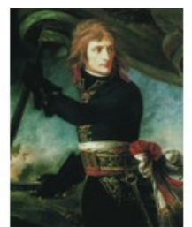
图3 青年将军拿破仑