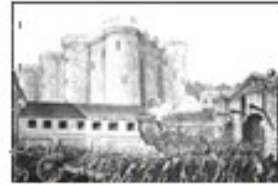
巴黎人民攻占巴士底狱。

12.当今世界使用的多款主流智能手机，大多数需由多个国家分工协作组装完成，而不是单纯某一个国家可以独立完成的。它反映的世界经济发展趋势是（ ）