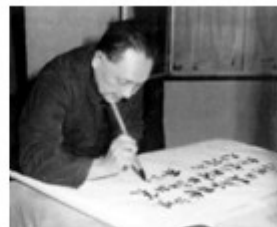
邓小平为深圳特区题词