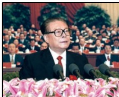
图3 邓小平在十一届三中全会上 图4 江泽民在中共十六大上作报告

(1) 根据材料一并结合所学知识，指出图 1 人物领导了什么革命？其革命的指导思想是什么？图 2 人物领导了什么起义？他在农村创造了什么革命局面？