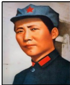
图1 孙中山 (1866-1925) 图2 到达陕北后的毛泽东