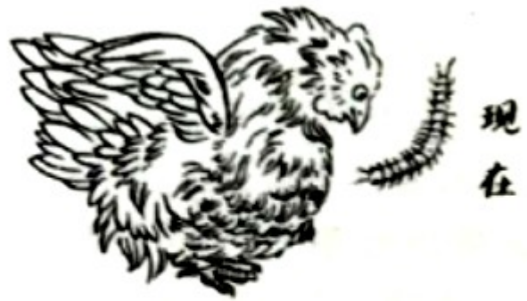
图2 《日本的今昔(局部)》 (40年代初发表)