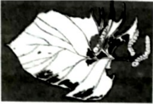
图1 《我们只怕蚕食》 (1938年发表)