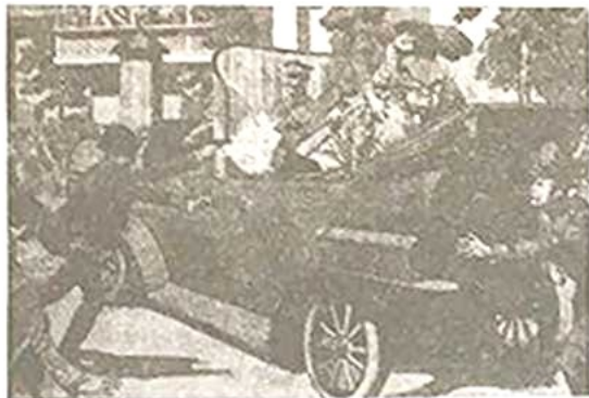
图一萨拉热窝事件