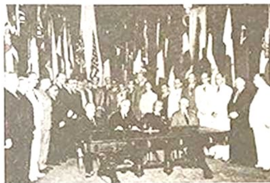
图二《联合国家宣言》签署