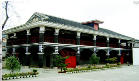
图二：生死攸关 历史转折。