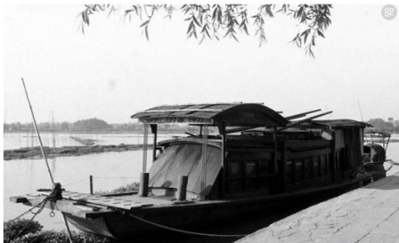
图一：开天辟地 党的诞生