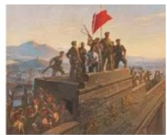
人民解放军占领南京“总统府”

材料二：“40 年前，中国共产党作出了实行改革开放的历史性抉择，大江南北涌动滚滚春潮，中国特色社会主义迸发勃勃生机。从 1.8%到 15%，这是 40 年来中国经济总占世界份额的攀升幅度；从 97.5%到 3.1%，这是 40 年来中国农村贫困发生率的下降幅度……成功由低收入国家跨入中等偏上收入国家行列。”