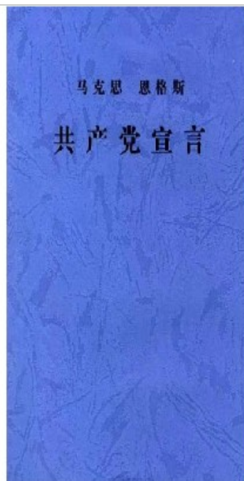
图2 1848年版的《共产党宣言》德文版（封面）