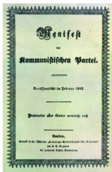
图2 1848年版的《共产党宣言》德文版（封面）