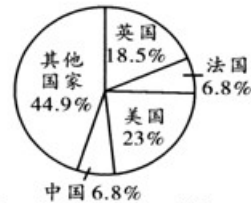
1900年，英、法、美、中等国制造业产量相对份额表

(3) 根据材料三，指出美国制造业产量占比的变化特点，结合所学知识分析产生这种变化的原因。