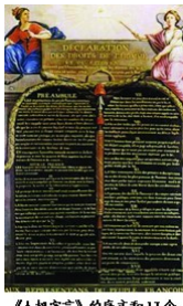
《人权宣言》的序文和17个 条款的纪念版

10.它的发表，表述了马克思主义基本原理，指明党的最终目标是解放无产阶级和全人类。该著作是