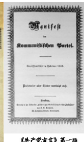
《共产党宣言》第一版 (德文版)封面