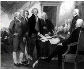
《独立宣言》通过的场景