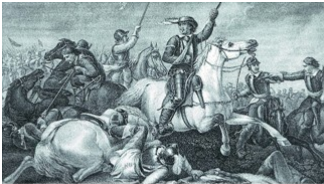
B. 战斗中的新模范军