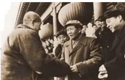
农业实现合作化后 农民代表向党中央和毛主席报喜