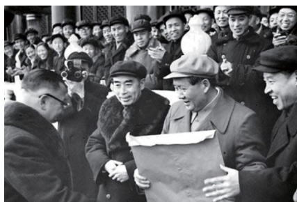
工商业实现全行业公私合营后 工商界代表向党中央和毛主席报喜