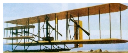
A B C