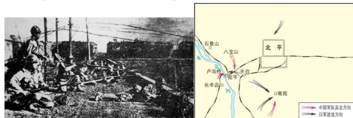
图一 日军占领沈阳