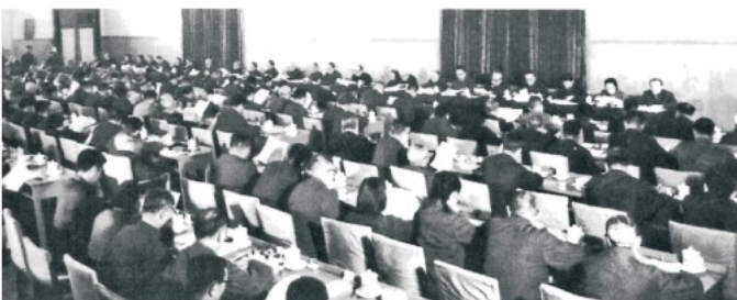
中共十一届三中全会会场