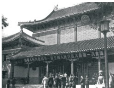
人民代表步入第一届全国人民代表大会第一次会议会场