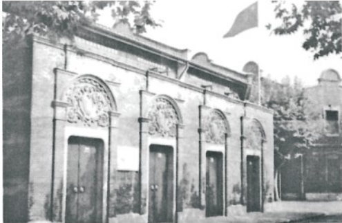
中国共产党第一次全国代表大会上海会址

(1) 据以上图片，结合所学知识回答，中共“一大”确定的党的中心工作是什么？“一大”召开有什么重大历史意义？