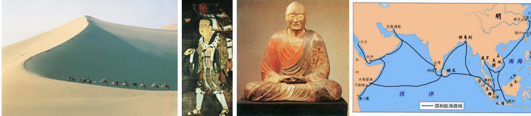
丝绸之路上的商队 玄奘 鉴真 郑和下西洋路线图

2. 某历史兴趣小组进行研究性学习, 收集到一些资料。下面这组图片资料体现的主题是 ( D )