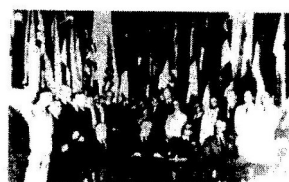
图二 《联合国宣言》签字仪式