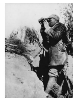
彭德怀指挥 百团大战