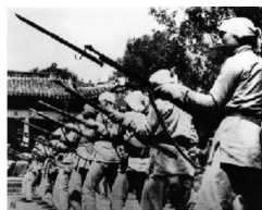
冀中抗日武装 回民支队