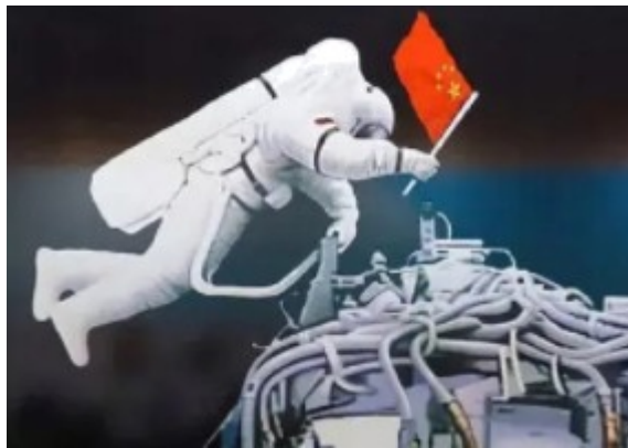
图 1 神舟五号载人飞船成功着陆，杨利伟走出舱门 图 2 神舟七号载人飞船，翟志刚太空漫步