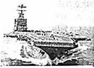
杜鲁门号航空母舰