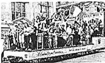
纽约市举行盛大游行庆祝哥伦布日

19. 图中所庆祝的纪念日，最早在 1937 年由美国总统富兰克林·罗斯福宣布为每年的 10 月 12 日。自 1971 年开始，此纪念日被正式定于 10 月的第二个星期一。此节日的设立，主要是为了纪念哥伦布（ ）