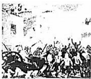
起义者英勇抗击英国军队

21. 如图反映的历史事件是19世纪中期的一场声势浩大的民族大起义。这场起义发生于（ ）