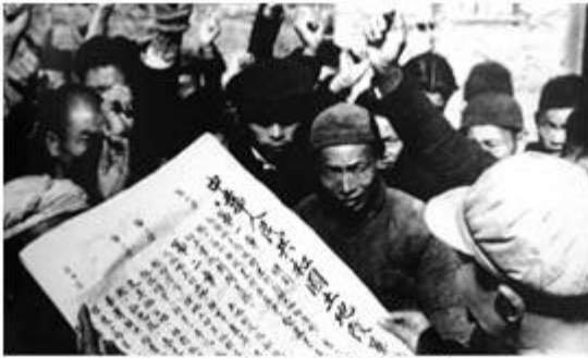
向农民宣传土地改革法