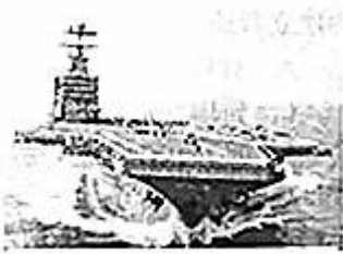
杜鲁门号航空母舰