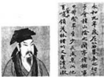
王羲之和《兰亭序》（摹本局部）

4. 图中的历史人物被后人称为“书圣”，他集书法之大成，自成一派，影响深远，该图中的作品反映了他所使用的哪种书法字体？（ ）