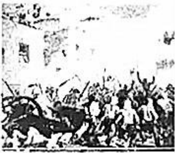
起义者英勇抗击英国军队