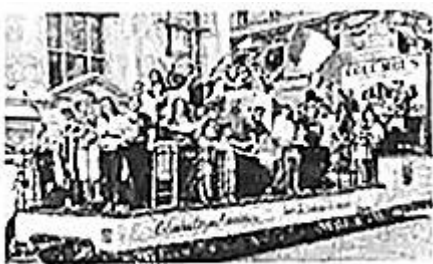
纽约市举行盛大游行庆祝哥伦布日

19. 图中所庆祝的纪念日，最早在 1937 年由美国总统富兰克林·罗斯福宣布为每年的 10 月 12 日。自 1971 年开始，此纪念日被正式定于 10 月的第二个星期一。此节日的设立，主要是为了纪念哥伦布（ ）