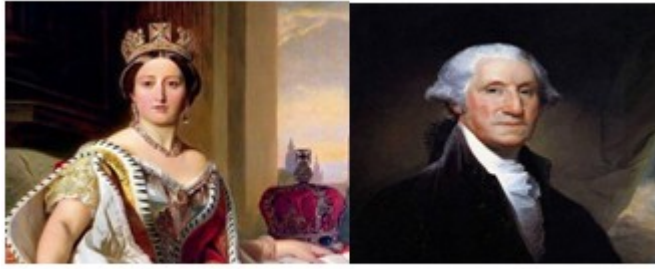
英国女王维多利亚