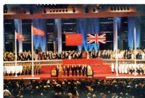
中英香港交接仪式