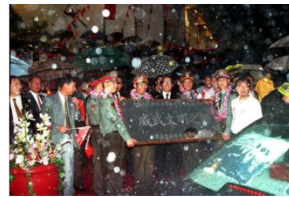
解放军驻港部队接管香港防