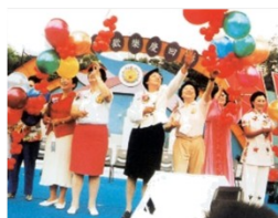
香港人民欢庆回归祖国