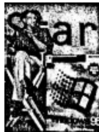
比尔·盖茨和微软品牌