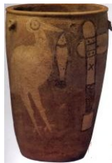
鹤鱼石斧纹陶缸（约5000年前）