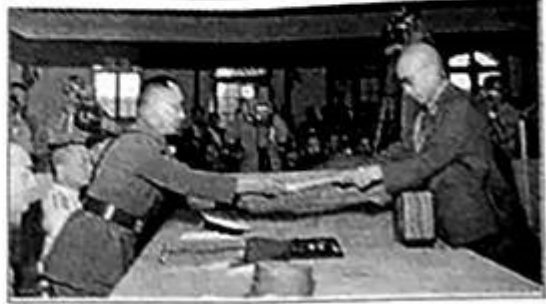
日本投降签字仪式

(2) 那一天，烽火燎原。根据材料，运用所学知识说明七七事变是中国十四年抗日烽火中的重要节点。 《人民日报》报道：“天色已晚，天安门广场这时变成了红灯的海洋……举着红灯游行的群众像火龙似地穿过全城，使新的首都沉浸在狂欢里直到深夜。” (3) 那一天，民族新生。请谈谈你对“民族新生”的理解。