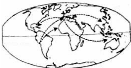
马铃薯传播路线示意图

【相关链接】1939年美国出台《市场推广法案》，依据法案成立了国家马铃薯委员会，进行贸易立法和纠纷的解决；各州根据不同的气候和土壤条件，选择种植不同用途的马铃薯；专门成立研究中心，进行新品种培育、深加工处理、化肥农药使用量、节水等研究。