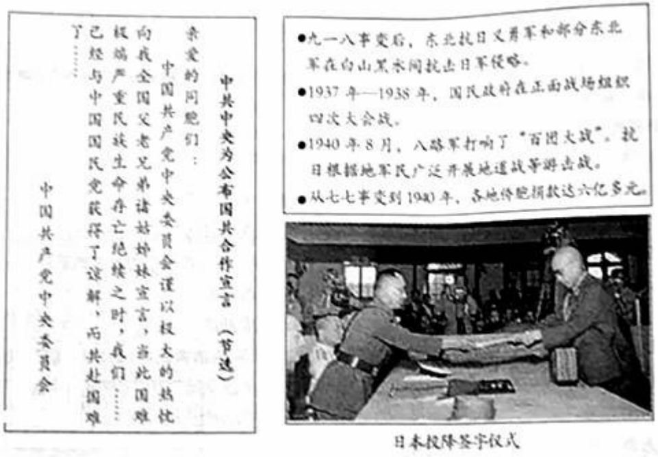
日本投降签字仪式

(2) 那一天, 烽火燎原。根据材料, 运用所学知识说明七七事变是中国十四年抗日烽火中的重要节点。 《人民日报》报道: “天色已晚, 天安门广场这时变成了红灯的海洋……举着红灯游行的群众像火龙似地穿过全城, 使新的首都沉浸在狂欢里直到深夜。”