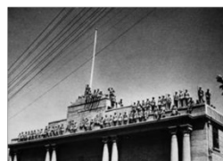
图四人民解放 军占领南京