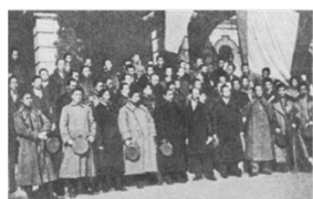
图二孙中山与临时 参议院议员合影