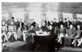
图一《南京条约》 签订的场景

16.南京，见证了近代中国沧桑的历史。有人形象地说它既是中国近代史的起点，也是中国近代史的终点。