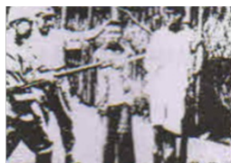
图三日军把南京青年 当作刀靶练习刺杀