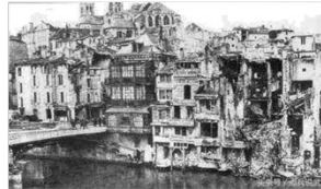
图二 遭到炮轰后的凡尔登