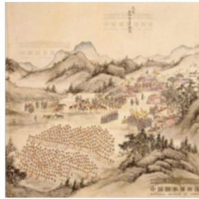
图一顺治会晤五世达赖图