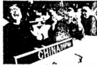
图三 中国代表在 26 届联大上