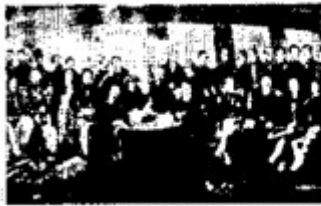
图一 《南京条约》签字场景