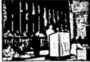
图二 周恩来总理在万隆会议上发言