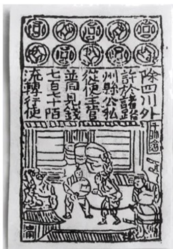
图2北宋纸币铜版拓片