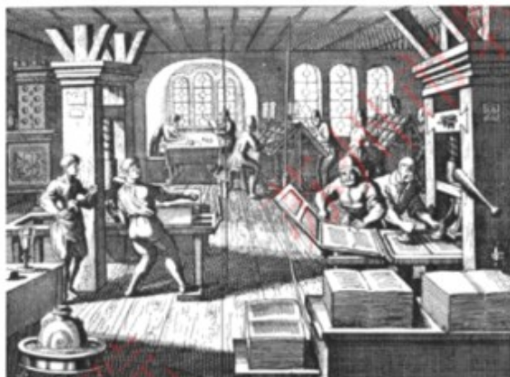
15 世纪中期约翰·古腾堡发明铅活字印刷机

(1) 读材料一,敦煌莫高窟造像体现了中华文化与哪一宗教文化的融合?徐光启等人主要学习了西方哪些学科门类的先进知识?