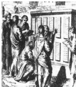
颁布《十二铜表法》想象图