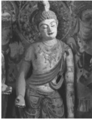
敦煌莫高窟第 45 窟菩萨(盛唐)

万历年间,徐光启与利玛窦在北京合作翻译了欧几里得的《几何原本》。崇祯二年(1629年)朝廷任命徐光启督修历法。他聘请耶稣会士龙华民、汤若望等参加,最终以《崇祯历书》为总题目,编译了 46 种、137 卷巨著,详细介绍了欧洲先进的天文学知识。