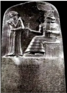
《汉谟拉比法典》石柱局部图