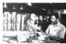
图二 在日资公司工作的印度工人