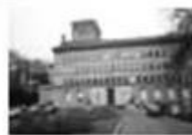
图三 世界贸易组织总部大厦