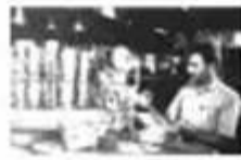
图二 在日资公司工作的印度工人