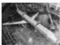
图一 中国与美国合作生产的第一架 NH3-M2 飞机