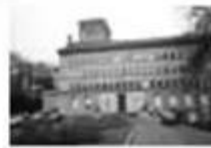
图三 世界贸易组织总部大厦