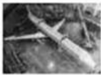
图一 中国与美国合作生产的第一架MD-82飞机