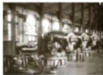
江南制造总局制炮厂