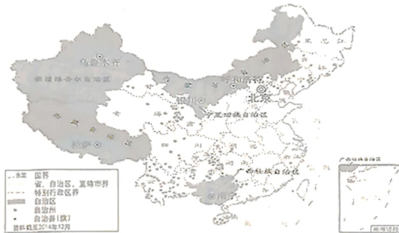
民族区域自治示意图