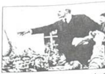
图② 列宁在苏维埃代表大会上