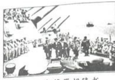
图③ 日本签署投降书